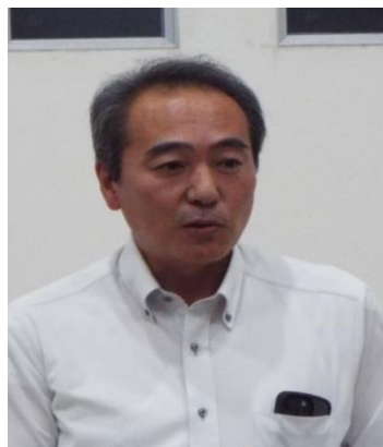
久慈地区 ご来賓 前岩手県議会議員 岩城 元様