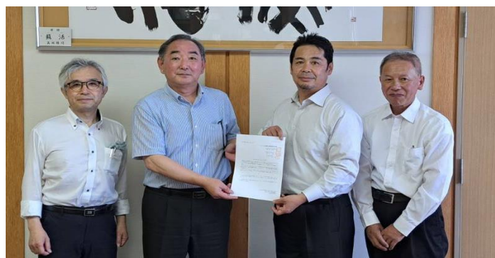
写真左から2番目は普代村村長の柁屋伸夫様