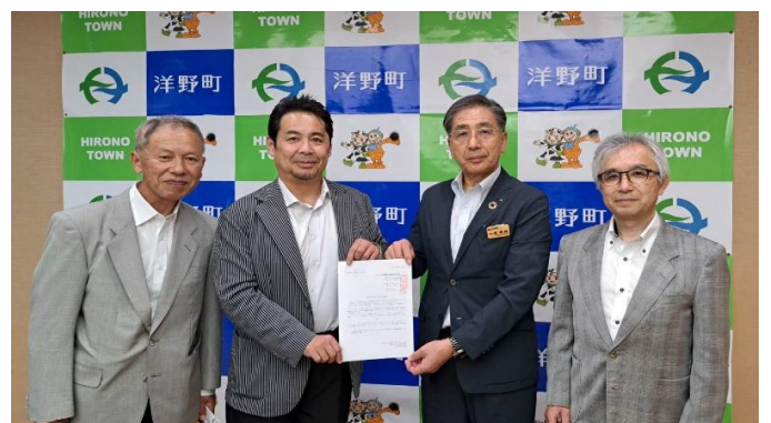
写真左から3番目は洋野町副町長の林剛敏様