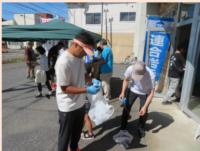
上・子ども達と一緒に行動しました。 中・遠野市役所前のゴミを拾います。 下・集めたゴミを分別します。 来年度は、遠野バイパスの清掃になる予定です。