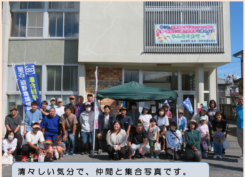
清々しい気分で、仲間と集合写真です。 昨年に引き続きの開催になりました。

遠野地区では、加盟団体の組合員及びその家族約40人が、3つの班に分かれて東館町の遠野教育児童会館からJR遠野駅、稲荷下運動場、遠野市民センターまでの往復路のゴミを拾いました。